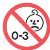
图 A.1 年龄警告的图标

对 36 个月以下儿童可能构成危险的玩具应附警告,例如:“警告:不适合 36 个月以下儿童使用”或“警告:不适合 3 岁以下儿童使用”或采用图 A.1 图标。